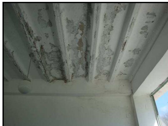
7-8. kép: az öltözők mennyezete