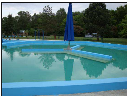
10. kép: A termálmedencék

A nyitás az előre nem látható betonozás miatt csúszott. Elvileg már május 2-án ki tudtunk volna nyitni, de a rossz idő miatt nem kockáztattuk meg a festést, ezért nyitottunk 7-én. Az úszómedence egy héttel később lett megnyitva. A rossz idő miatt nem okozott akkora gondot az egy hetes csúszás, így a vendégek sem panaszkodtak.