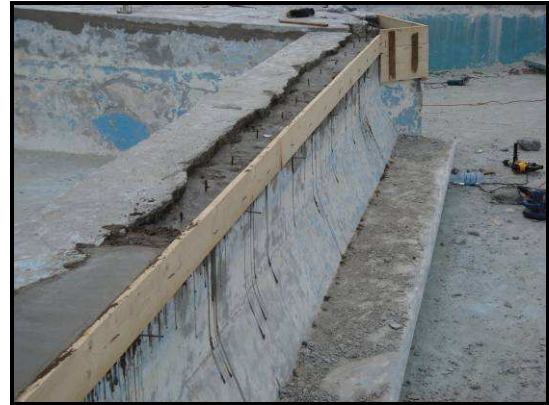
4. kép: 3-as medence falának javítása