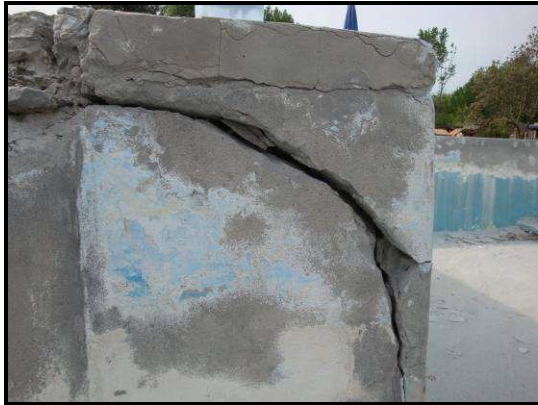
3. kép: 3-as medence sérült sarok

majd erre erős betonréteget öntöttünk. A jobb tapadás érdekében egy speciális adalékkal kezeltük a felülete és a betont is.