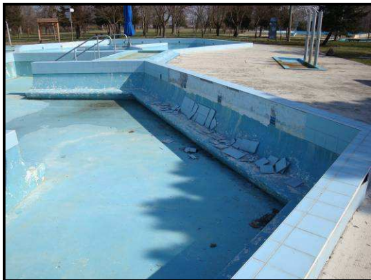
1. kép: Lecsúszott csempesor 2011.04.01.

A 2007-es korszerűsítés alkalmával a termálvizes medencék csempeburkolatot kaptak a vízvonallal felett. Mint utóbb kiderült, akkor sem távolították el az addig felhordott rétegeket, így a csempek egy idő után elkezdtek lepotyogni. Eleinte csak kevés, majd az idő előrehaladtával, illetve a téli fagyok erősségétől függően kisebb-nagyobb felületeken. Az elmúlt évben már körülbelül 50%-a vált el a faltól. Az alkalmazottak elmondása alapján volt olyan eset, amikor üzemelés közben csúszott le a csempe, miközben a fürdőzők a medencében tartózkodtak.