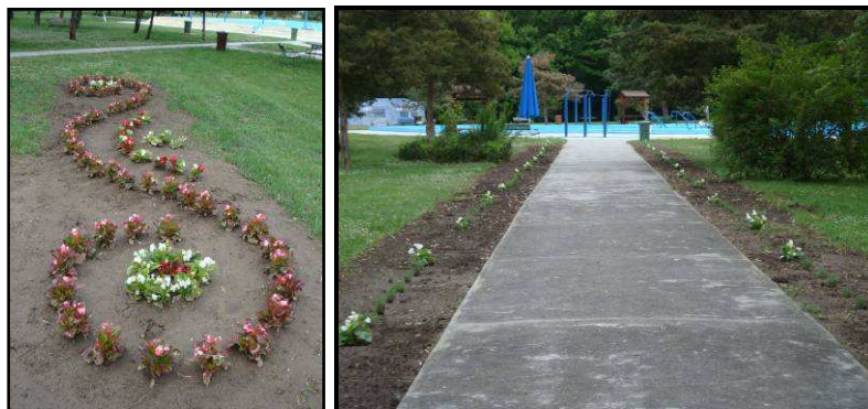
9. kép: Virágok

A hosszú távú fejlesztési tervben szerepel a parkosítás is, amit megelőlegeztem egy levendulasorral – a medencékhez vezető 60 m-es járda két oldalán. A vendégek területbejárési szokásait figyelembe véve nem ültethettük zárt sorra, így csak minden második járdaközt telepítettük be. Mivel a levendula évelő, ezért ez egyszeri beruházás volt, látványos eredménnyel. (100 tő levendulát ültettünk el a területen.)