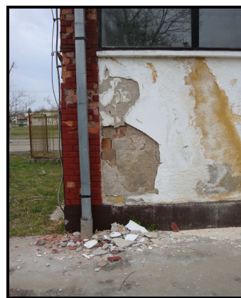
5-6. kép: A főépület

Az iskolától kért két kőműves kijavította a főépület leomlott vakolatát, a hölgyek ezalatt kifestették az épületet belülről, majd kívülről.